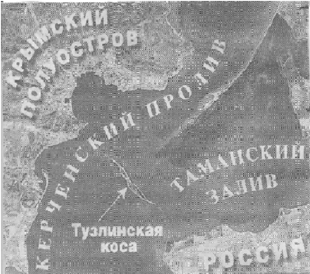
Рисунок 2 – Тузла – спорная коса между Украиной и Россией